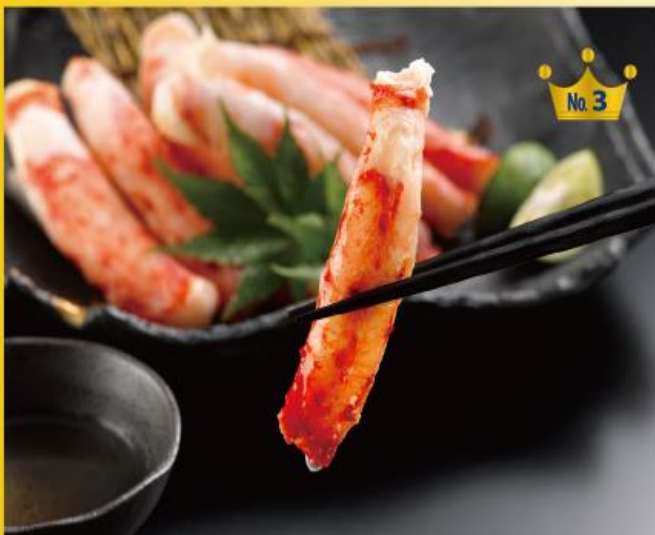
原産国：ロシア 加工地：日本 保存方法 冷凍 (-18℃以下) たらば400g 10本から25本

殻むき不要で解凍するだけで食べられるのが 人気のたらば蟹の棒肉。 蟹の殻むきは面倒という方にオススメです。 ボイルだから解凍すればそのまま召し上がれます。