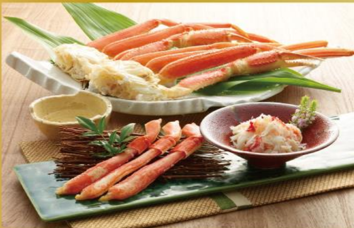
原産国：ロシア 加工地：日本 保存方法 冷凍 (-18℃以下) ずわい800g 15~25本