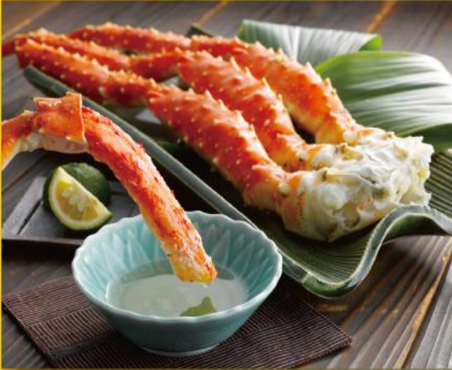
原産国：ロシア 加工地：日本 保存方法 冷凍 (-18℃以下) たらば800g 3本から10本