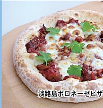
淡路島ボロネーゼピザ