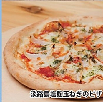
淡路島塩麹玉ねぎのピザ