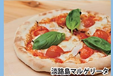
淡路島マルゲリータ