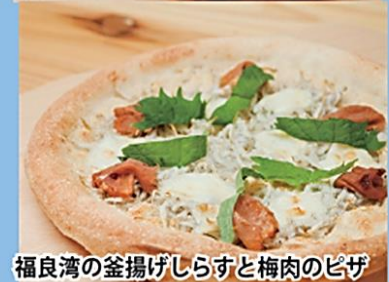
福良湾の釜揚げしらすと梅肉のピザ