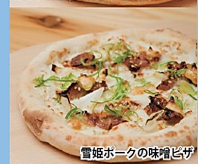
雪姫ポークの味噌ピザ